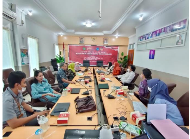
Gambar 1. Kegiatan Penutupan AMI